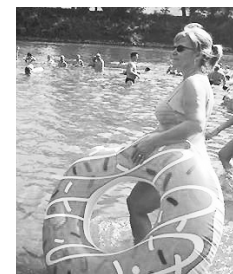
A nyári hőségben a Panyolafeszt helyett a tiszai csobbanást választották a vendégek

A program zárónapján délelőtt istentiszteleten vettek részt a vendégek. Ebéd után a mie-