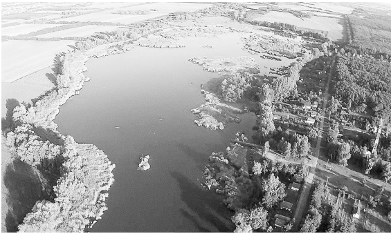
A vajai tó a fejlesztések után igazi turistaparadicsommá válhat (drón fotó, internet)

Mint lapunk hasábjain többször is hírt adtunk róla, számos pályázatot nyújtott be a város különböző fejlesztési célokra. Sokáig kellett ugyan várni az elbírálásokra, azonban nem hiába vártunk.