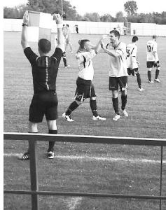
Örömteli pillanat a Fényeslitke–Vaja mérkőzésen, melyen 2:10-re verte csapataunk az ellenfelet

Ez a kis boszorkány a nyírbátori vármúzeum panoptikumában kipróbálta milyen is seprűn lovagolni. Az iskola nyári Erzsébet táborának sok-sok programja közül a nyírbátori kirándulás volt az egyik legjobb.