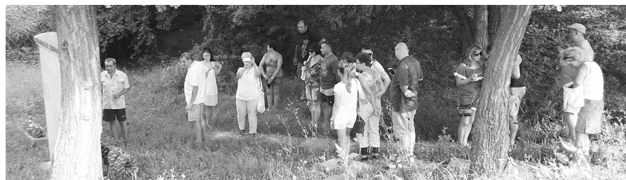
Ezen a helyen állt a kurta kocsmát Tunyogmatolcs határában, karnyújtásnyira a Szamosról amit Petőfi Sándor is megénekelte „Falú végén kurta kocsmát” című versében

Számos helyen jártak, így például Kocsordon, a Székely Hadosztály emlékművénél. Tunyogmatolcs határában felkeresték azt a helyet, ahol egykor a Petőfi Sándor költeményében is megörökített kurta kocsmát állt. Penyigén a lekvárium és a helytörténeti