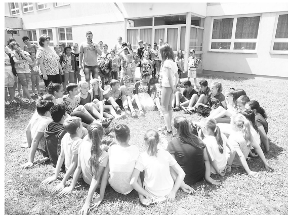
A nyári verőfényben jó volt a szabadban játszani

Az ötnapos program zárásaként a pénteket a vajai tónál töltötték az iskolások. A nap során játékos foglalkozásokat tartottak számukra. Megismerkedtek a gyerekek az íjászattal és a