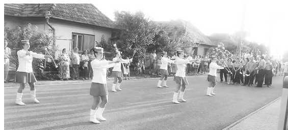
Többször is felléptek, és mindig nagy sikert arattak a vajai mazsorették

tézményeivel való jó együttműködési startégiáját és szó esett pro és kontra a fiatalok részvételéről a döntéshozatalban. A szakmai programot sajtótájékoztató és közös nyilatkozat kiadása zárta.