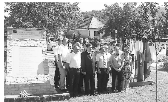
Harasztkeréken augusztus 19-én avatták fel a Testvértelepülések parkját az emlékművel, melyen a helységek nevei olvashatóak.

Az Európai Unió „Európa a polgárokért” programjának társfinanszírozásában valósult meg az Ákosfalvi napok keretében a partnertelepülések találkozója. Megvitatották az EU in-