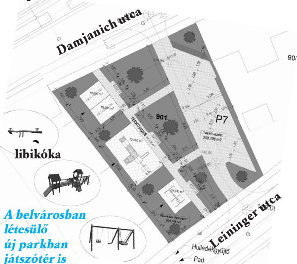
A belvárosban létesülő új parkban játszótér is helyet kap – képzünk az előzetes látványterv

A zöld város létrehozásának tervét már régen célul tűzte maga elé az önkormányzat. Az elképzelés lényege, hogy minél több legyen a szabad, nyitott tér a városban, s minél nagyobb felületen zöldelljen fa, fű, s pompázzon virág.