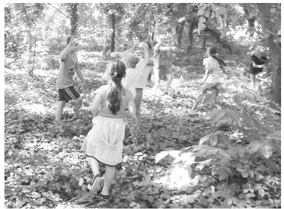
Az egyik legizgalmasabb játék a számháború

lövészettel is. Délben az ott főzött ebéd mindenkinek nagyon jól esett. Az egy hét végén sok-sok élménnyel gazdagodva búcsúztak a napközis táborától, a gyerekek.