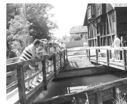
Egy kihagyhatatlan látnivaló: a túristvándi vízimalom. Itt volt az ebédet is, ami egy tájegységi specialitással, kötöttésztával lezárult

Nem csoda, hogy ese fáradtan ültek asztalhoz a közös vacsorára az óvodában, majd onnan sietve mentek a szálláshelyre, a kiskastélyba, hogy mielőbb nyugovóra térhessenek.