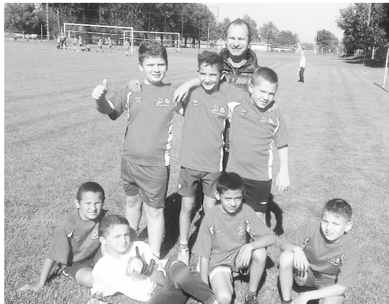
Ez klassz! – jelzi feltartott ujjal a kis játékos, aki a legutóbbi szezonban már ott rúgta a bőrt a többi fiúval

Sok kisfiú ábrándozik arról, hogy egyszer sikeres focista lesz. Most itt az alkalom, hogy akinek kedve van, kipróbálja a tehetségét. A Bozsik-program keretében a 2004-2011 között született gyerekeket várják Vaján focizni.