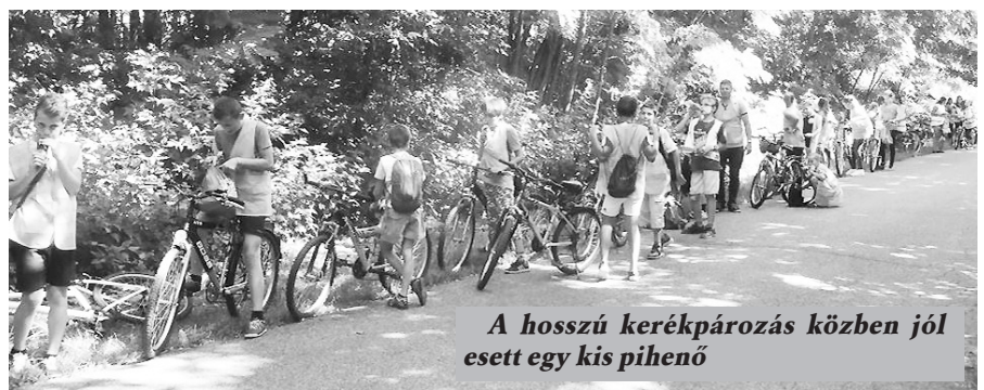
A hosszú kerékpározás közben jól esett egy kis pihenő

lövészettel is. Délben az ott főzött ebéd mindenkinek nagyon jól esett. Az egy hét végén sok-sok élménnyel gazdagodva búcsúztak a napközis táborától, a gyerekek.