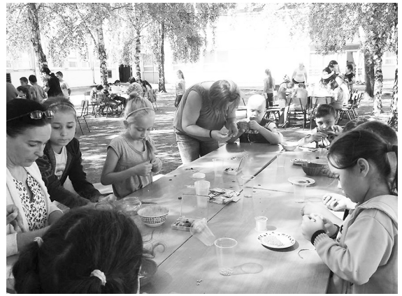
Kézműves foglalkozás az udvaron – nagyon más így az iskola...